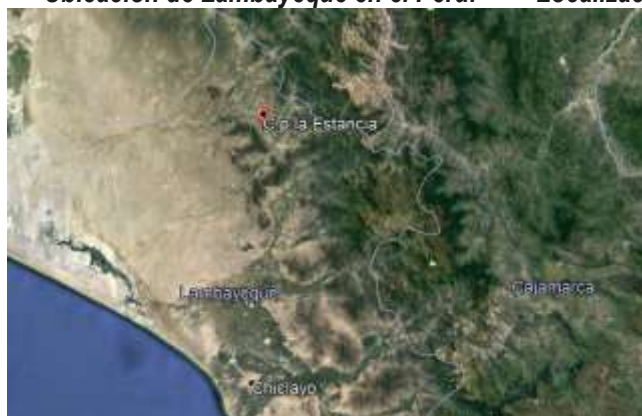
Localización Geográfica del C.P LA ESTANCIA