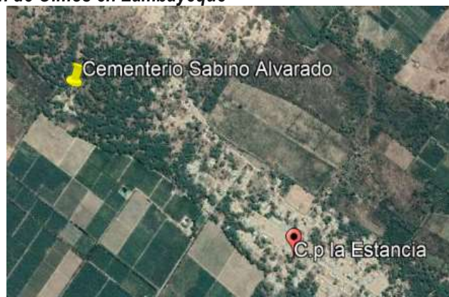
Localización de la zona del proyecto