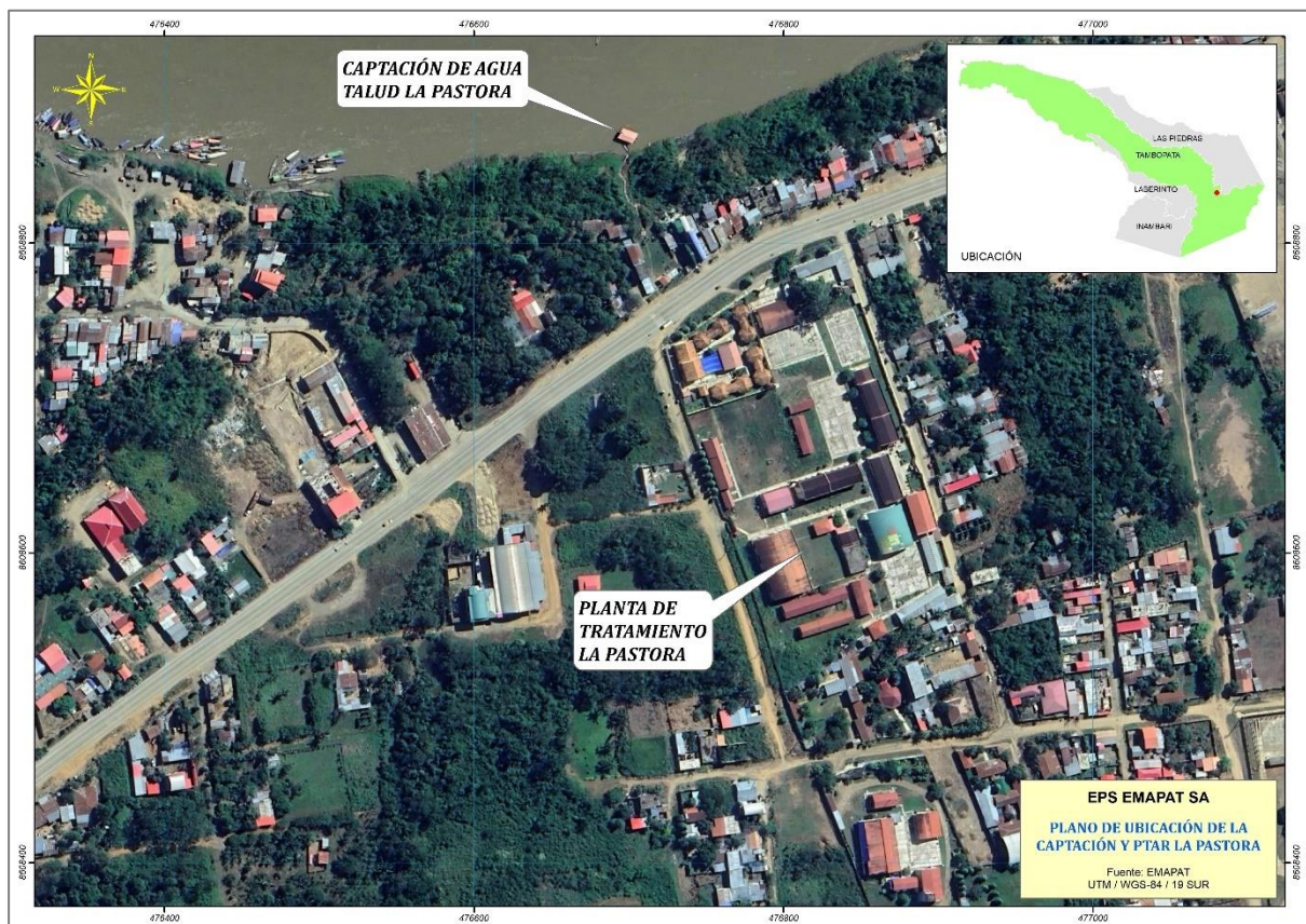
Plano 1: Ubicación del Ámbito de Intervención