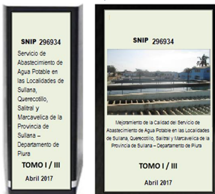
Ilustración 1: Modelo de Presentación del Expediente Técnico