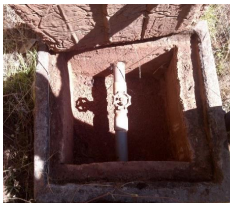
Cámara seca de la captación inoperativo