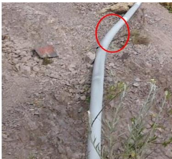
Tuberías expuestas a la intemperie, en etapa de cristalización y con presencia de roturas

El Centro Poblado de Simpe cuenta con 38 conexiones de diámetro de 1/2" domiciliarias existentes con fugas y presiones bajas por las fallas funcionales del sistema.