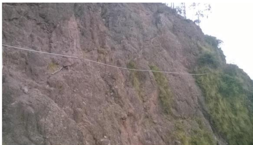
Tubería expuesta con riesgo a roturas.