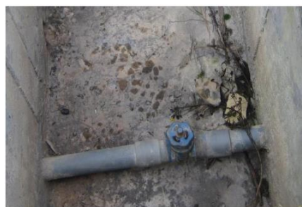
Captación en mal estado de conservación y válvula de control con signos de filtración