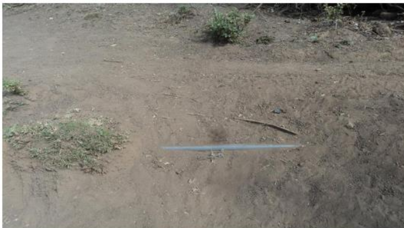
Vista de la tubería de la red de distribución de sistema de agua existente.