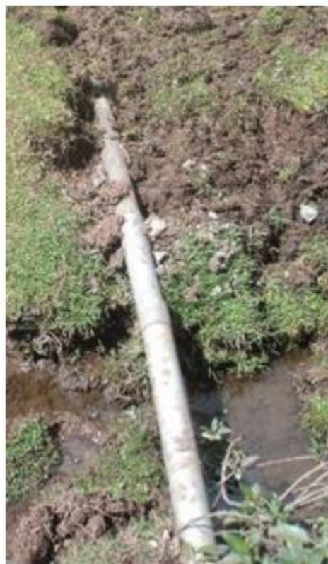
Tuberías expuestas a la intemperie