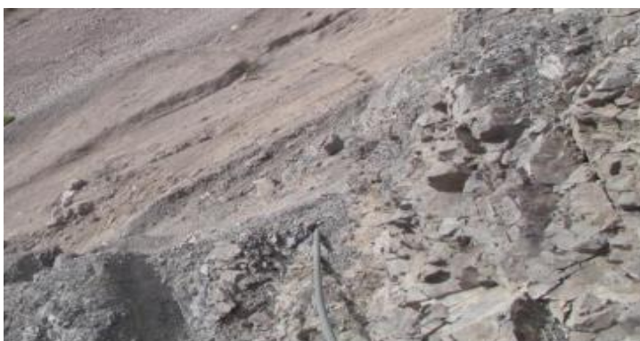
Tramos de tubería de la línea de conducción expuesta