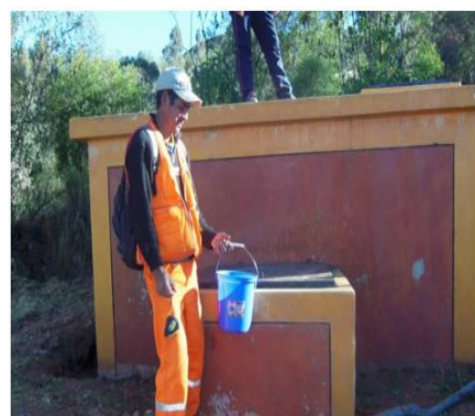
Reservorio N°1 de volumen 19 m 3 en buen estado de conservación