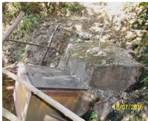
Captación cuenta con estructuras en malas condiciones con presencia de filtraciones y fisuras