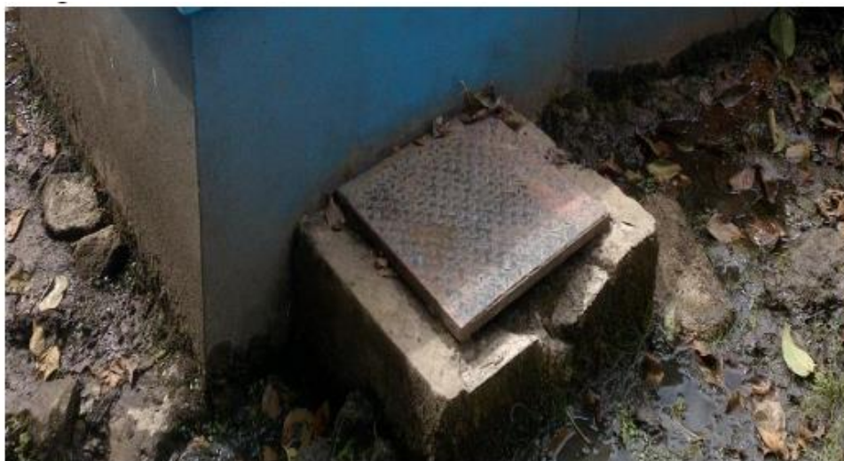
Estructura de la caja de válvulas totalmente deterioradas