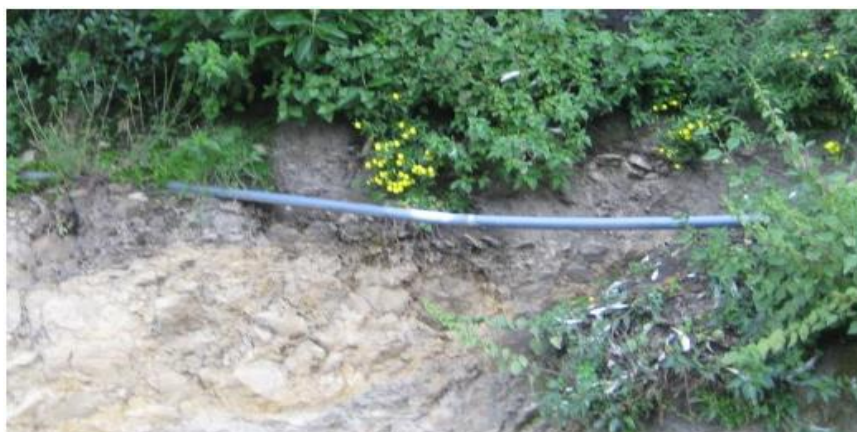
Tuberías expuestas y con signos de roturas