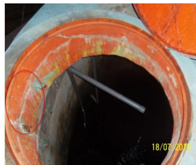
Reservorio N°1 de volumen 19 m 3 en buen estado de conservación Reservorio de 20 m 3 con presencia de rajaduras en su estructura y la tapa metálica de acero se encuentra en proceso de corrosión requiere demolición total.

Actualmente cuenta con línea de aducción y red de distribución instalada para las viviendas de la zona, fue construido en el año 1996 por FONCODES y aporte de mano de obra no calificada por parte de los usuarios, tiene las siguientes características.