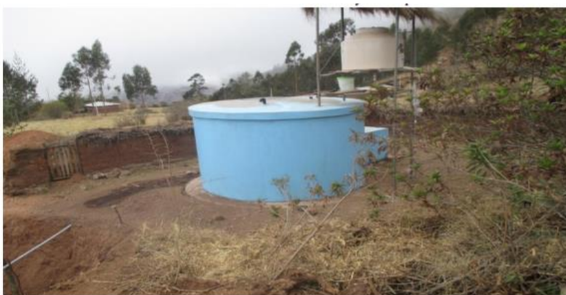
Reservorio Circular de 14 m 3 en buen estado de conservación