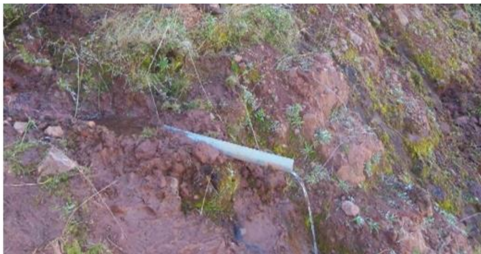
Situación Actual de la Tubería en la Línea de Conducción expuesta a la intemperie.