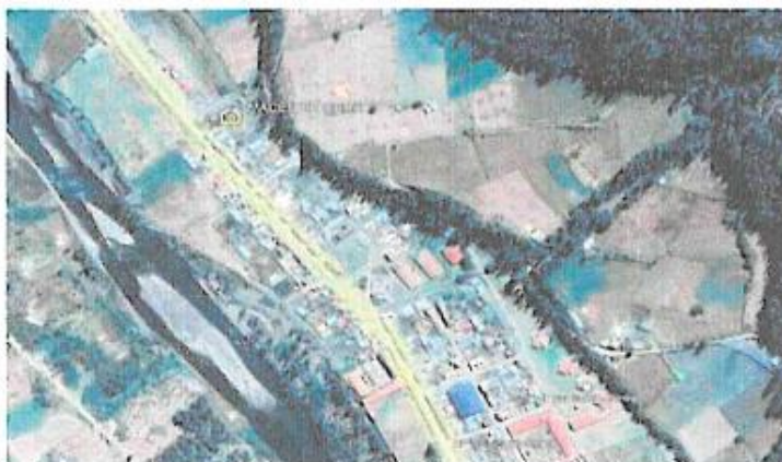
Imagen: Ubicación de la Obra.