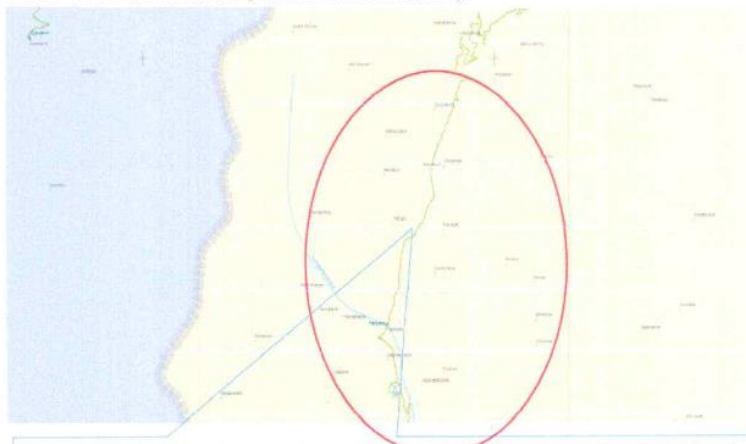
Camino Vecinal: Acahuasi (Km 00+175) - Ichubamba - Ccaccahuara (Km 15+175) - Pantipata (KM 29+175)

El contratista debe cumplir los siguientes requisitos: