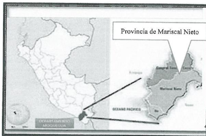
UBICACIÓN DEL PROYECTO