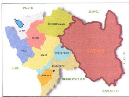
MAPA 03: UBICACIÓN GEOGRAFICA EN EL CONTEXTO PROVINCIAL