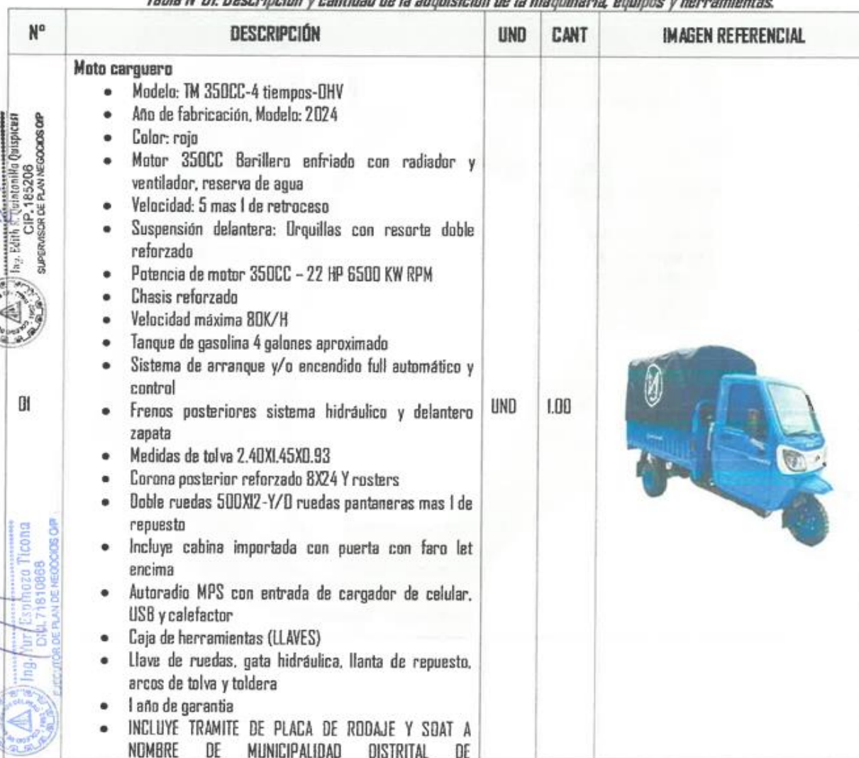
Tabla N°01: Descripción y cantidad de la adquisición de la maquinaria, equipos y herramientas.

La Adquisición de maquinaria, equipos y herramientas requerida en el presente proceso será de acuerdo a las especificaciones técnicas, de la siguiente manera: