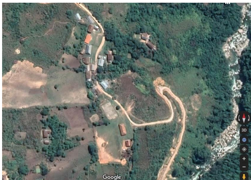
Mapa Satelital N° 05: Anexo San Francisco

Su geografía está profundamente marcada por las partes altas, la mayoría de los centros poblados en las faldas de los cerros sobre una pequeña planicie, Las cuencas de los ríos que desembocan en el caudaloso río Mishollo.