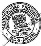
TABLA DE PENALIDADES – ACTIVIDADES DE EJECUCION DE OBRA

Asimismo, la Entidad ha considerado otras penalidades según lo establece el artículo 163° del Reglamento de la Ley de Contrataciones del Estado, las penalidades en tanto por 1000 del monto del contrato, se describe en la siguiente tabla.