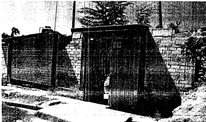
ILUSTRACIÓN N°02: Vista general de la institución educativa.