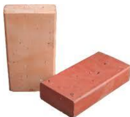
Adoquín de arcilla

Su capa de rodadura está conformada por adoquines de arcilla colocados sobre una cama de arena y con un sello de arena fina entre sus juntas. Pueden tener base o base y sub base con un espesor ligeramente menor que para pavimentos flexibles. Puede ser considerado como un pavimento mixto (rígido- flexible), Los pavimentos de adoquines son una adaptación de una vieja idea (pavimentos de piedra), pero con un nuevo material EL ADOQUIN DE ARCILLA presentando una gran cantidad de ventajas técnicas y económicas.