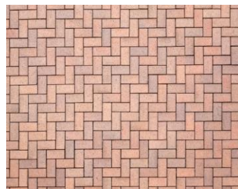
Piso adoquinado