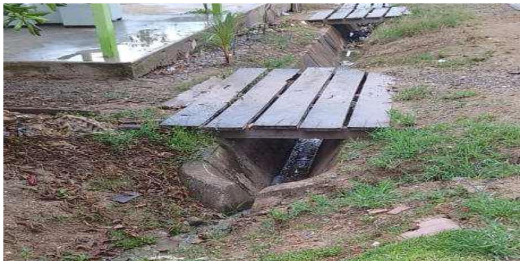
Se observa que la cuneta existente está en pésimas condiciones, debido al deterioro y el crecimiento de malezas