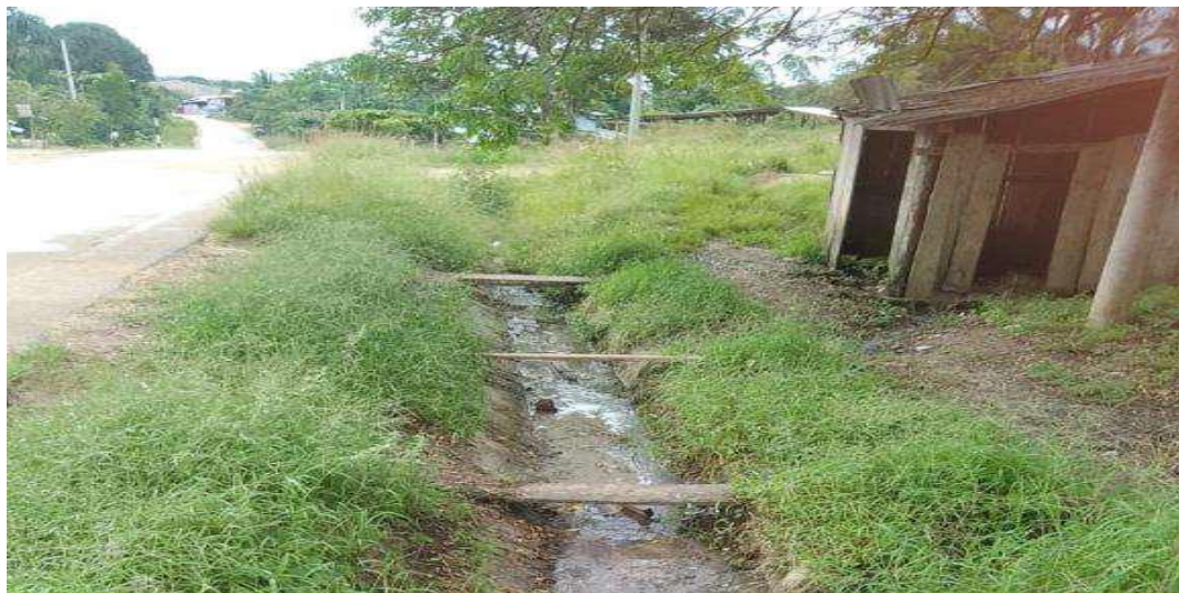
Se observa que la cuneta existente está en pésimas condiciones, debido al deterioro y el crecimiento de malezas

A continuación, se presentan fotografías con las cunetas existentes: