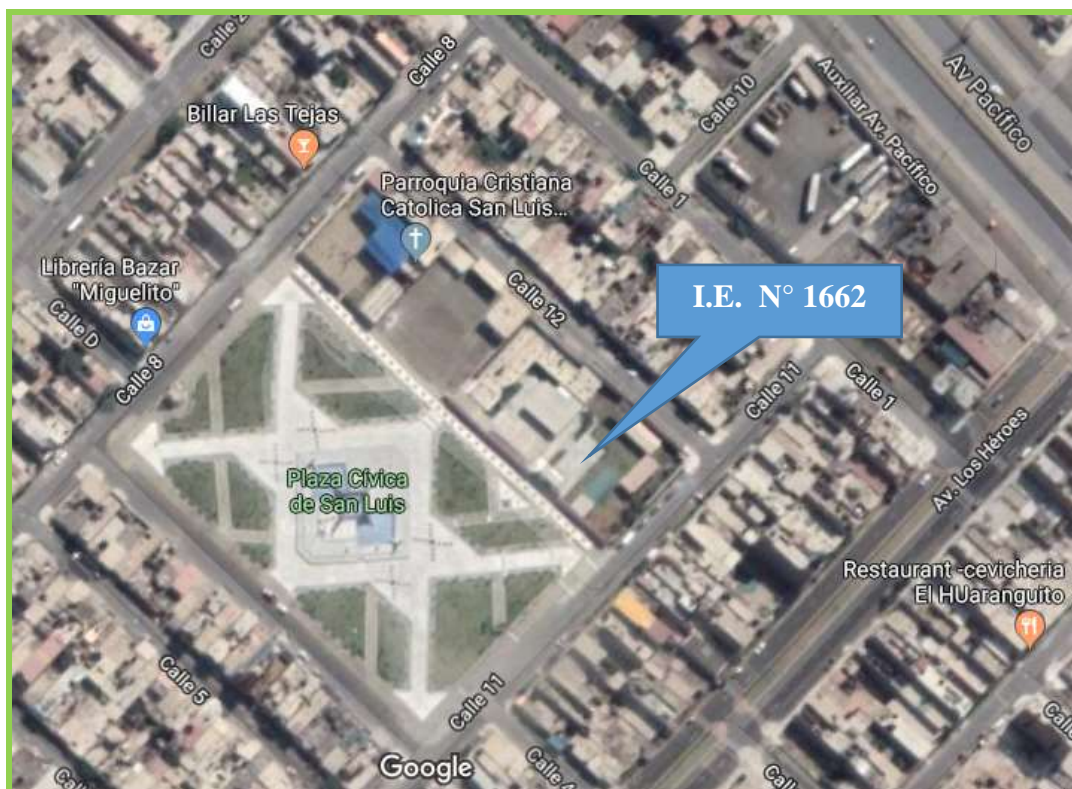
Grafico N° 01: Provincia de Santa, Distrito de Nuevo Chimbote, Villa San Luis

Región : Ancash Departamento : Ancash Provincia : Santa Distrito : Nuevo Chimbote