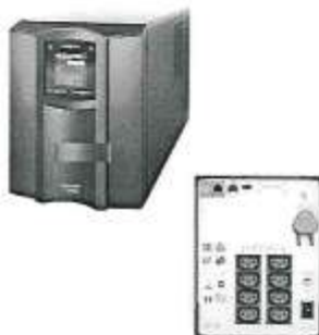
Imagen referencial 05

Tipo de batería: Batería de plomo y ácido. Tiempo típico de recarga 3hour(s). Vida útil esperada de la batería (en años) 3 – 5. Comunicaciones & Gestión: Puerto (s) Interfaz RJ-45 Serial, SmartSlot, USB. Panel de control Consola de estado y control, LCD multifunción. Descripción Física: Altura máxima 219mm. Anchura máxima: 171mm. Profundidad máxima: 493mm. Peso neto aproximado: 18.86kg. Temperatura de operación 0 - 40 °C. Ruido audible a un metro de la superficie de la unidad 41.0dBA. Aprobaciones y/o certificaciones : ISO, UL, NIST, IEC o similares