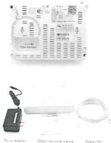
Imagen referencial 04

Es posible que la solución pueda incluir PoE para integrar el equipo de media converter y PoE en un solo dispositivo.