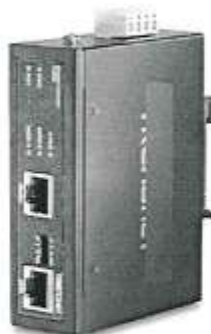
Imagen referencial 03