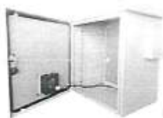
Imagen referencial 06