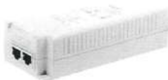
Imagen referencial 02

Aprobaciones y/o certificaciones : ISO, UL, NIST, IEC o similares