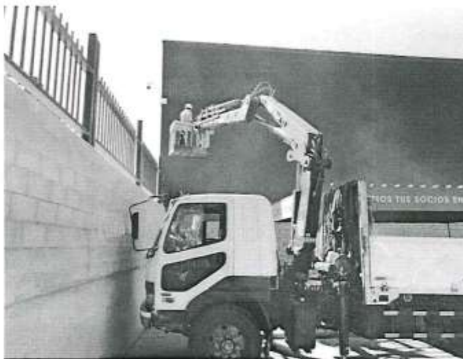
Imagen referencial 09

La unidad de medida es por unidad (UND).