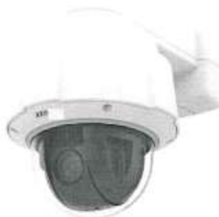
Imagen Referencial 01

TMP. Certificado de nivel 2 por FIPS 140-2.