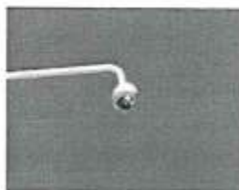
Imagen referencial 08

La reposición de las cámara PTZ con zoom óptico 40x y se hace en cada ubicación dentro de la ciudad de Puno. Existen cámaras ya instaladas y que necesitan ser reemplazadas. Se debe incluir grúa, mano de obra e insumos necesarios para la correcta reposición e instalación de las cámaras en cada punto, los postes donde están ubicadas las cámaras tienen una longitud de 15 metros como máximo.