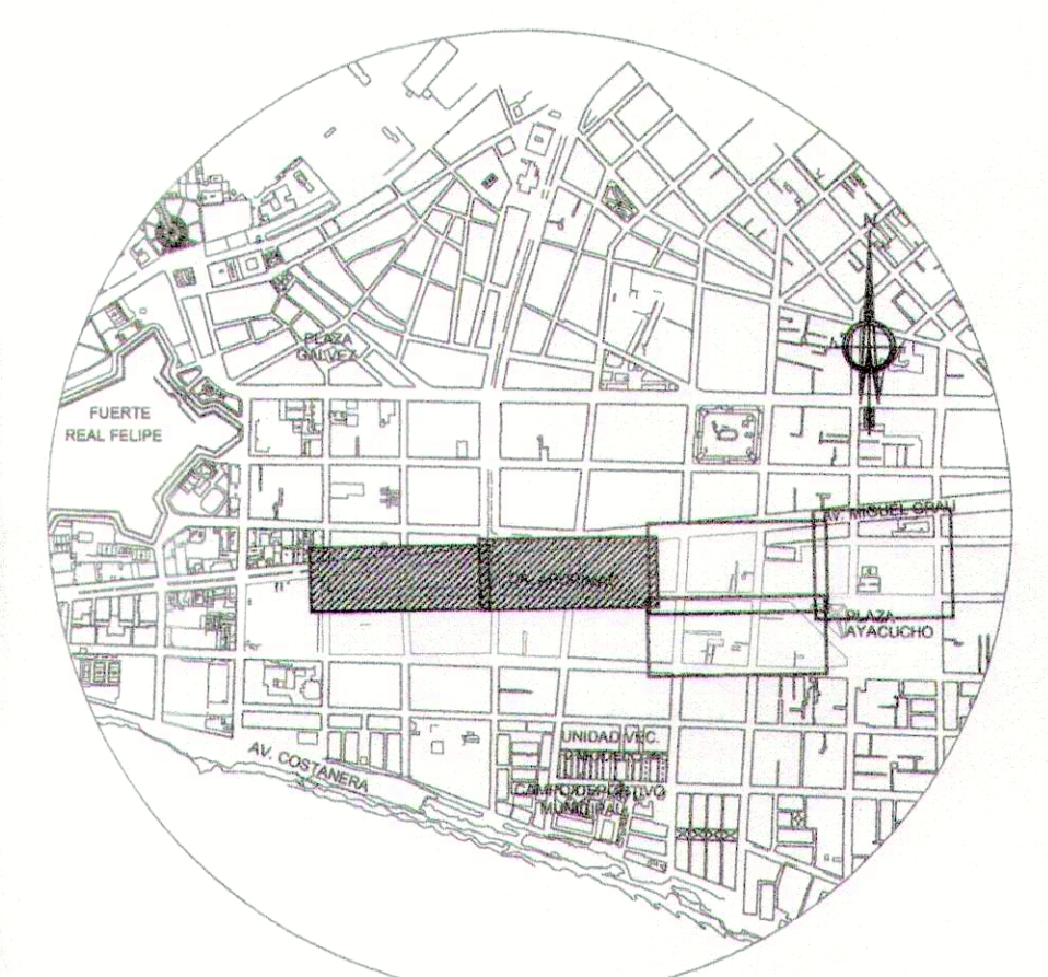
PLANO DE UBICACIÓN ESC 1:1500