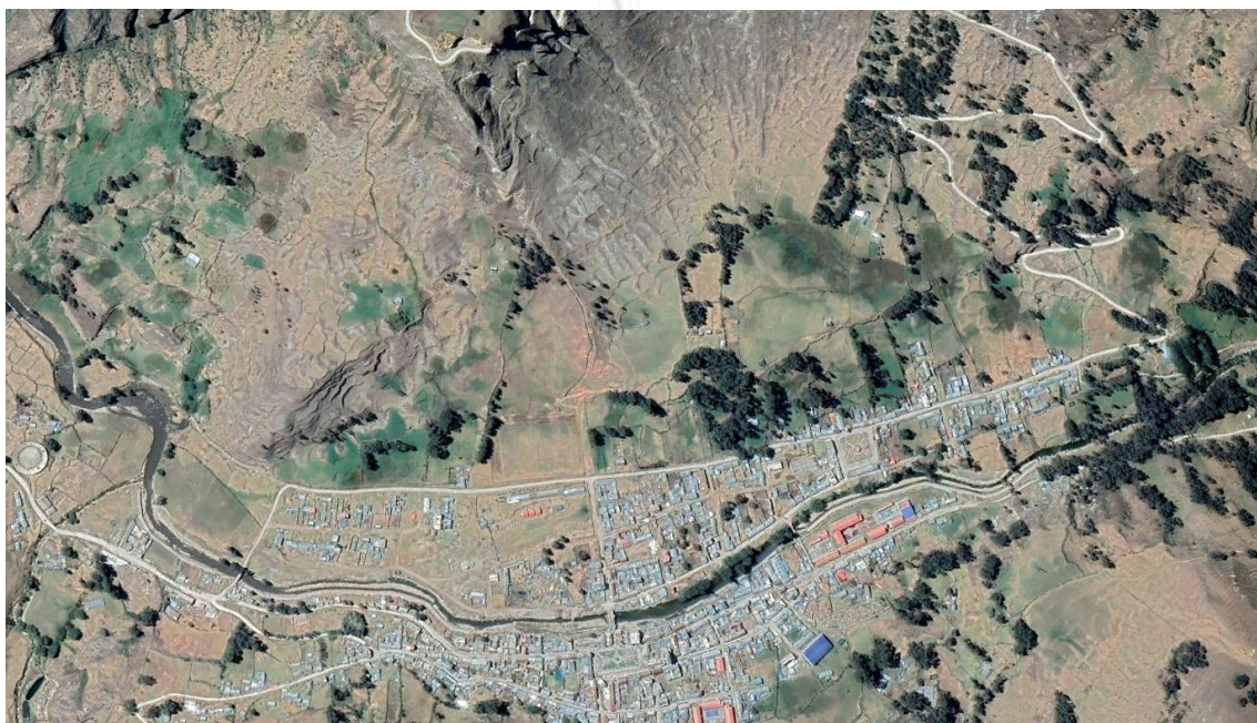
Imagen satelital: Se observa Centro Poblado de La Merced.