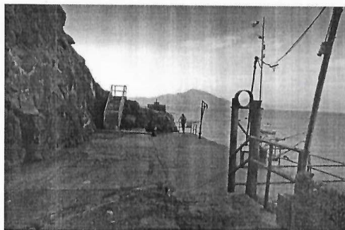
NUEVO CHIMBOTE, ABRIL DEL 2021

PARA LA CONTRATACIÓN DE LA EJECUCIÓN DE OBRA DEL PROYECTO DE INVERSIÓN PÚBLICA: "RENOVACION DE VIAS DE ACCESO; CONSTRUCCION DE COBERTURA; REPARACION DE AMBIENTE DE USOS MULTIPLES; EN EL(LA) DESEMBARCADERO PESQUERO ARTESANAL - PUERTO CASMA DISTRITO DE COMANDANTE NOEL, PROVINCIA CASMA, DEPARTAMENTO ANCASH".