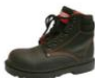
ZAPATO DE SEGURIDAD