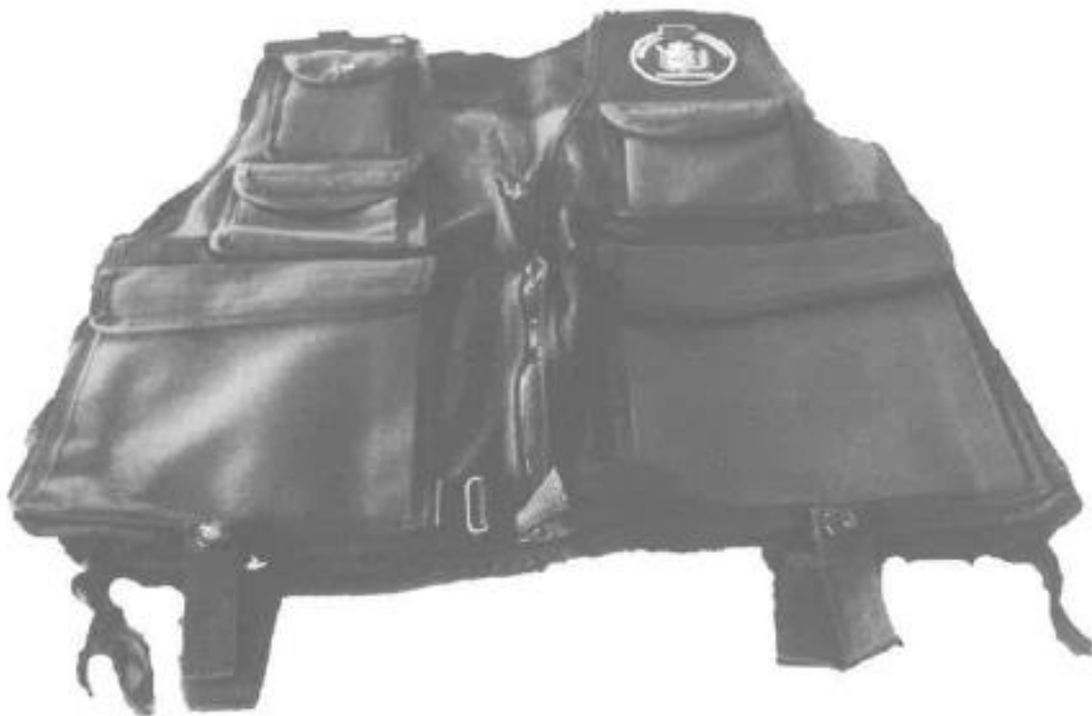
CHALECO TACTICO VISTA POSTERIOR