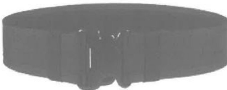
BARA DE GOMA