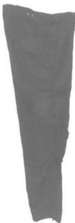
PANTALON VISTA LATERAL