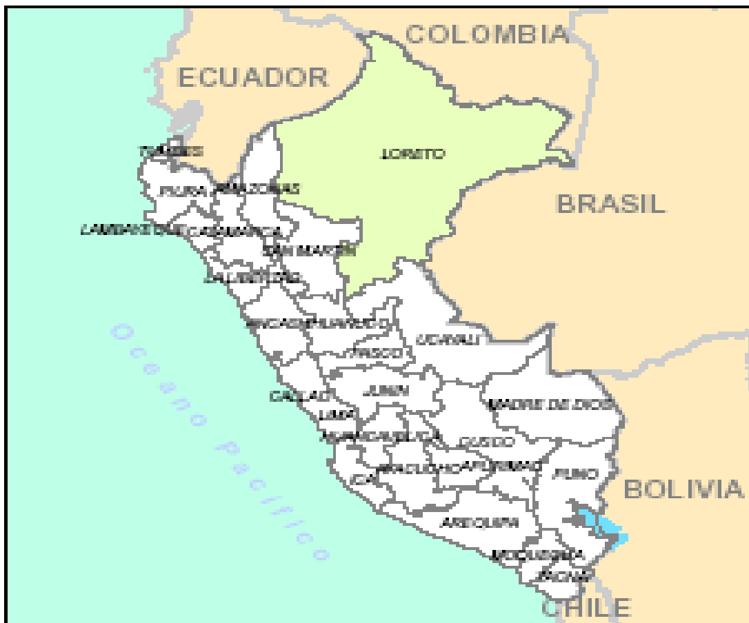
Mapa 01: Mapa de ubicación de la Región Loreto dentro del Mapa político del Perú.