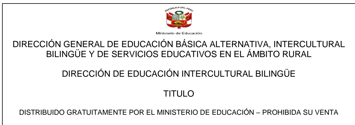
FIGURA N° 03