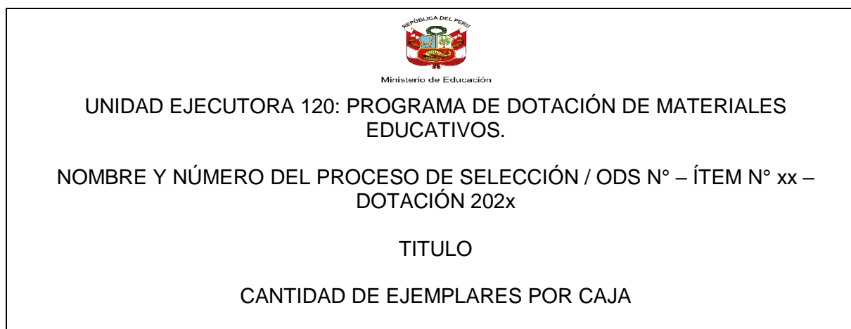
FIGURA N° 04