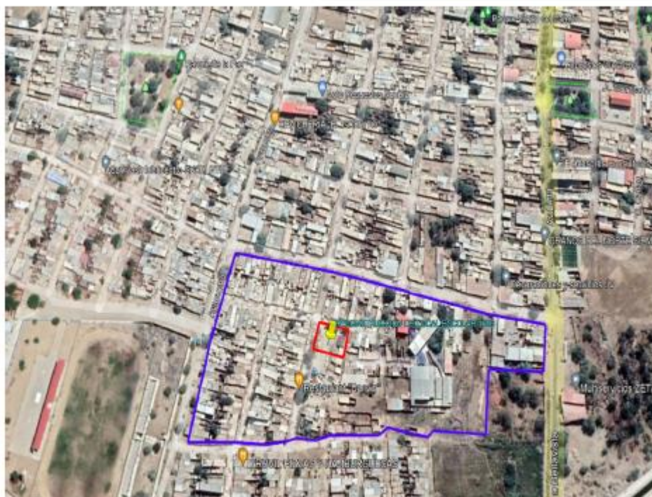
VISTA SATELITAL DEL AA. HH HÉROES DEL CENEP