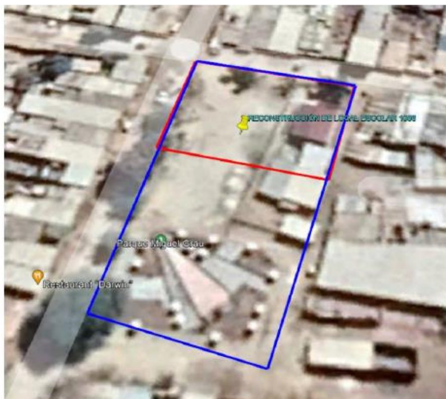
VISTA SATELITAL DEL TERRENO DONDE SE CONSTRUIRÁ LA INSTITUCIÓN EDUCATIVA.