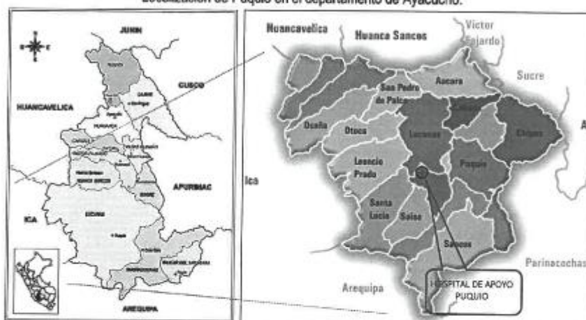
Ubicación de Puquio.