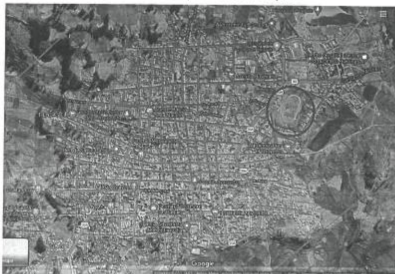
Localización del Estadio Municipal de de Puquio.