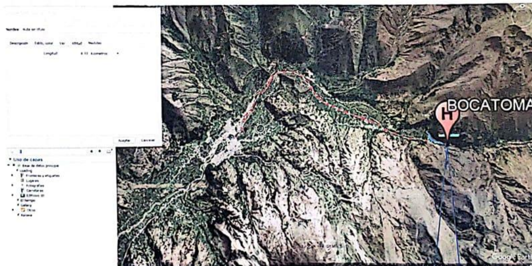
Mapa de Ubicación Política de la Fuente