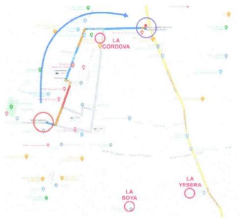
GRAFICO N° 03. MAPA DE VIAS DE ACCESO A LA ZONA.

Vías de comunicación de Camaná – Samuel Pastor (La Pampa) y las 03 estaciones de bombeo.