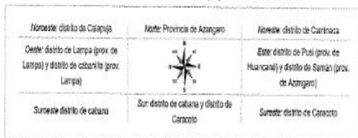
IMAGEN N°01: UBICACIÓN NACIONAL Y DEPARTAMENTAL