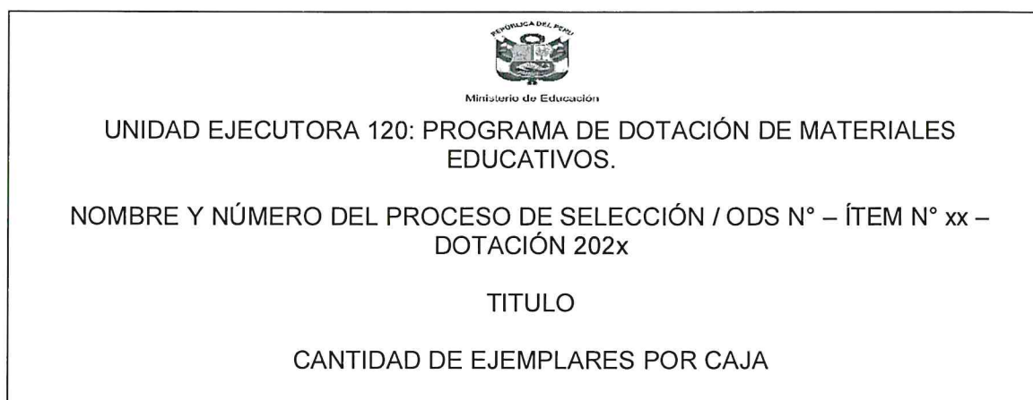
FIGURA N° 04