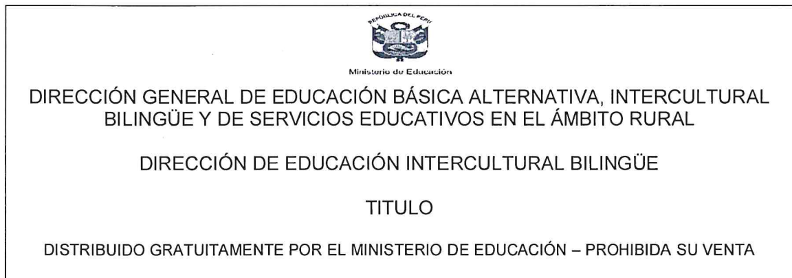
FIGURA N° 03