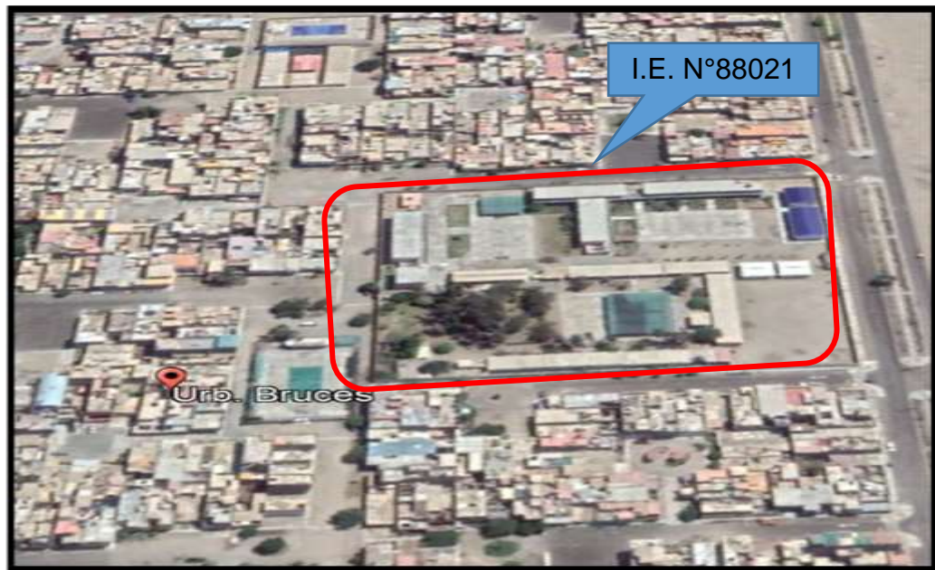
Grafico N° 01: Provincia de Santa, Distrito de Nuevo Chimbote, Urb. De Bruces MZ F2 Lote 1, Sector 1A - 1B