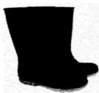
Botas de Jefe