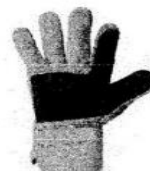
Guantes de Seguridad de Obra