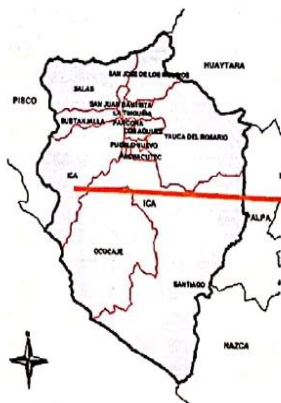
Provincia de Ica