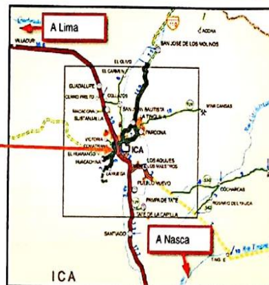
Distrito de La Tinguina