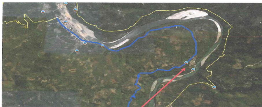
COMUNIDAD DE LIBETRADORES