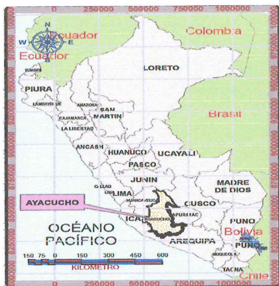
MAPA Nº 01: UBICACIÓN NACIONAL