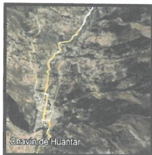
Grafica N°03 Micro localización del Proyecto

MUNICIPALIDAD DISTRITAL DE CHAVIN DE HUANTAR