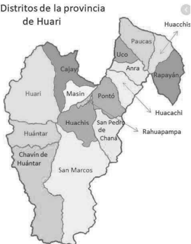
GRÁFICO N° 02