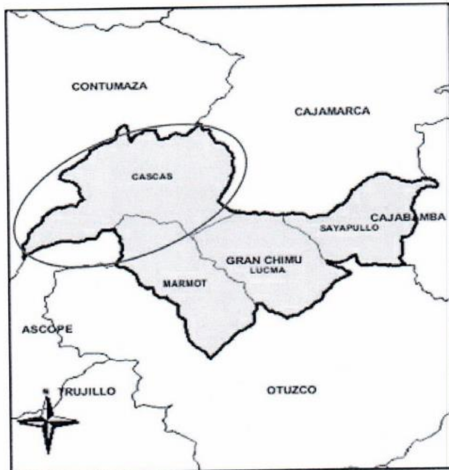
MAPA Nº 02: UBICACIÓN NACIONAL DEL DEPARTAMENTO DE LA LIBERTAD