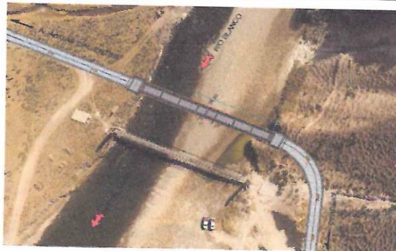
Ilustración N°03: Ubicación del proyecto.

"Año del Fortalecimiento de la Gobernancia Nacional"