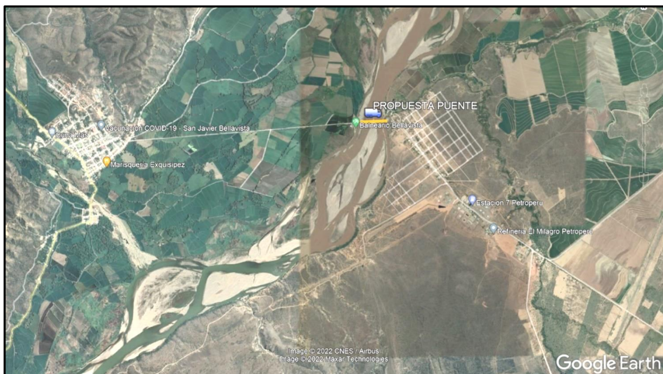
Imagen Satelital de la ubicación de la zona del proyecto

Además, al tener la posibilidad de solicitar financiamiento a PROVIAS DESCENTRALIZADO para la ejecución de obra, se deberá desarrollar y presentar el expediente técnico siguiendo la estructura de esta entidad financiera publicada en la página web www.pvd.gob.pe .