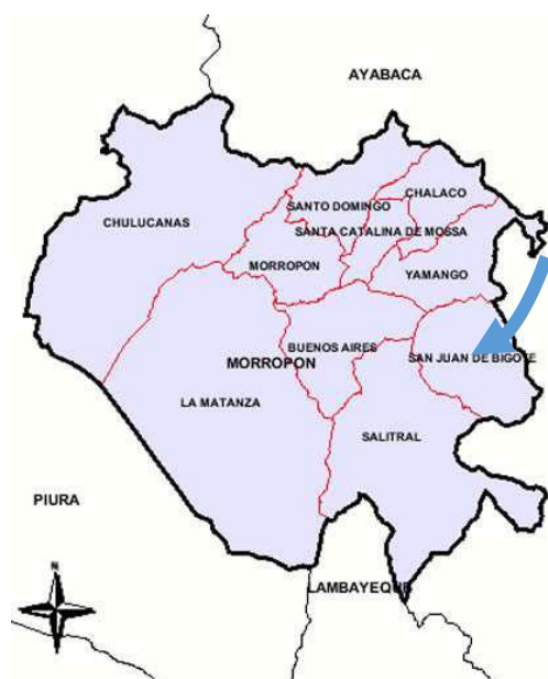
Gráfico N° 03: Provincia de Morropón.