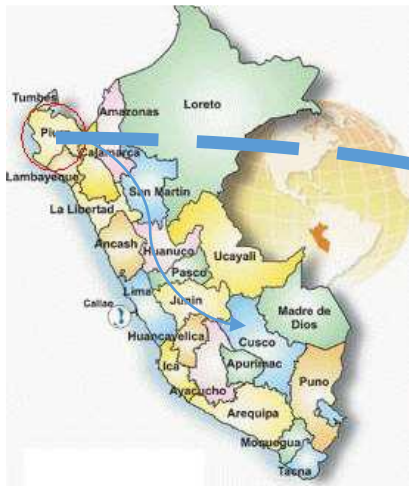
Gráfico N° 01: Mapa del Perú