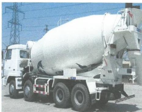
Figura 6: Camión concretero o Mixer para transporte de concreto.