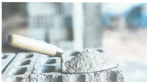
Figura 1: Cemento Portland tipo IP.

Todos los tipos de concreto, usarán cemento Portland tipo IP que deberá cumplir con lo estipulado en la norma ASTM-C150 (Norma AASHTO M85). El cemento debe encontrarse en perfecto estado en el momento de su utilización. Deberá almacenarse en lugares apropiados que lo protejan de la humedad, ubicándose en los lugares adecuados.