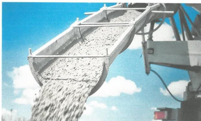
Figura 5: Colocación del concreto premezclado.

El concreto, deberá ser vaciado en forma continua y no debiendo ser colocado en grandes cantidades en un solo punto para luego ser extendido, ni debiendo fluir innecesariamente.