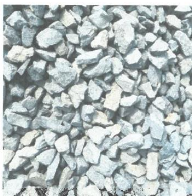
Figura 4: Piedra chancada (agregado grueso)