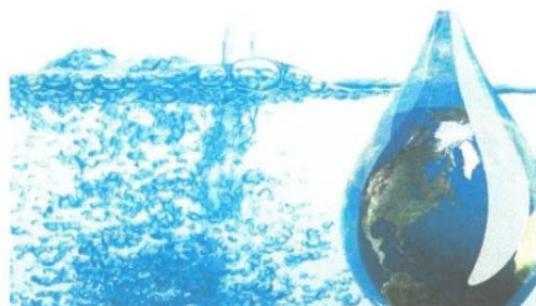
Figura 2: Agua potable para la fabricación del concreto.