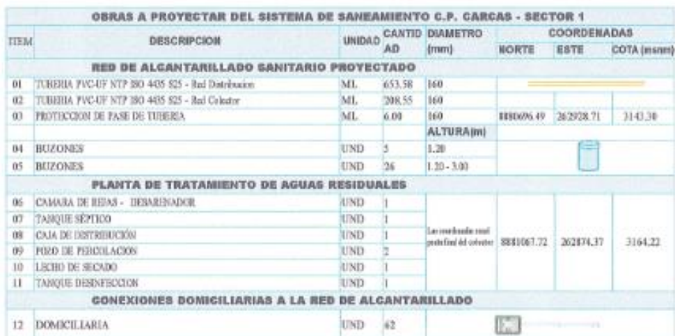
Tabla 44.- Metas del Sistema de Alcantarillado Sanitario Sector N°01 Carcas