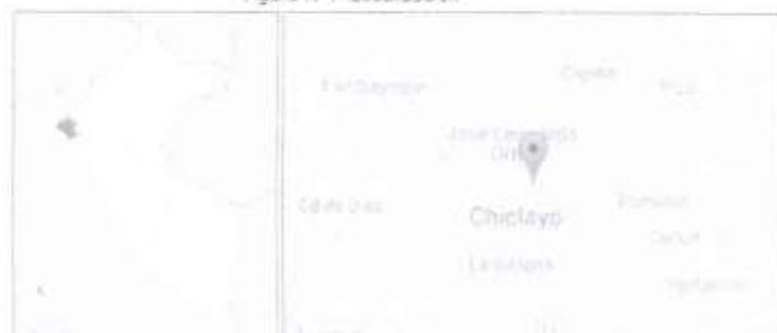
Figura N°1- Localización