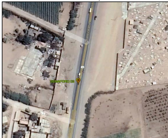
AV. PANAMERICANA – A FUNDO YAKUYMINKA