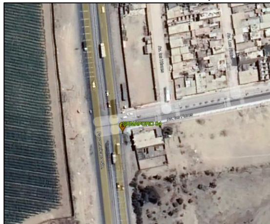
AV. PANAMERICANA – AV. Las Flores