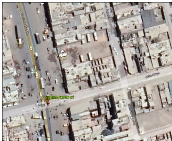
AV. PANAMERICANA - Av. José Olaya

Localidades : Chao, Nuevo Chao Distrito : CHAO Provincia : VIRU Región : LA LIBERTAD