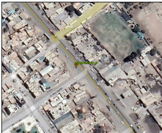
AV. PANAMERICANA – Calle San Martín