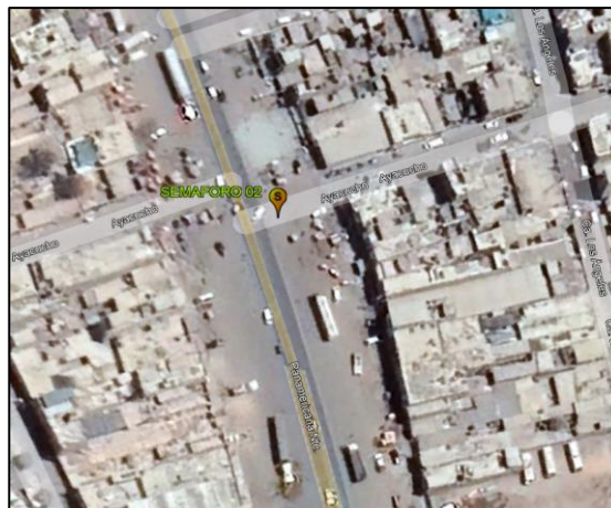
AV. PANAMERICANA - Av. 28 de Julio – Av. Ayacucho