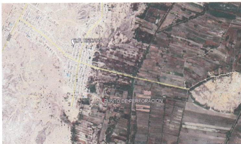
Figura N° 04: Ubicación del pozo a perforar.