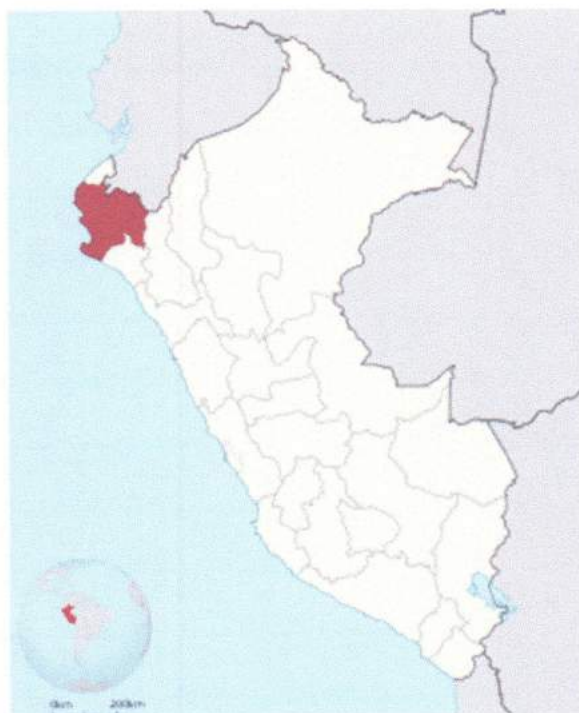
Figura N° 01: Ubicación del departamento de Piura.