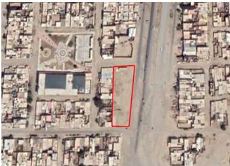
Gráfico 2. Ubicación del Nuevo Centro de Monitoreo de Seguridad Ciudadana