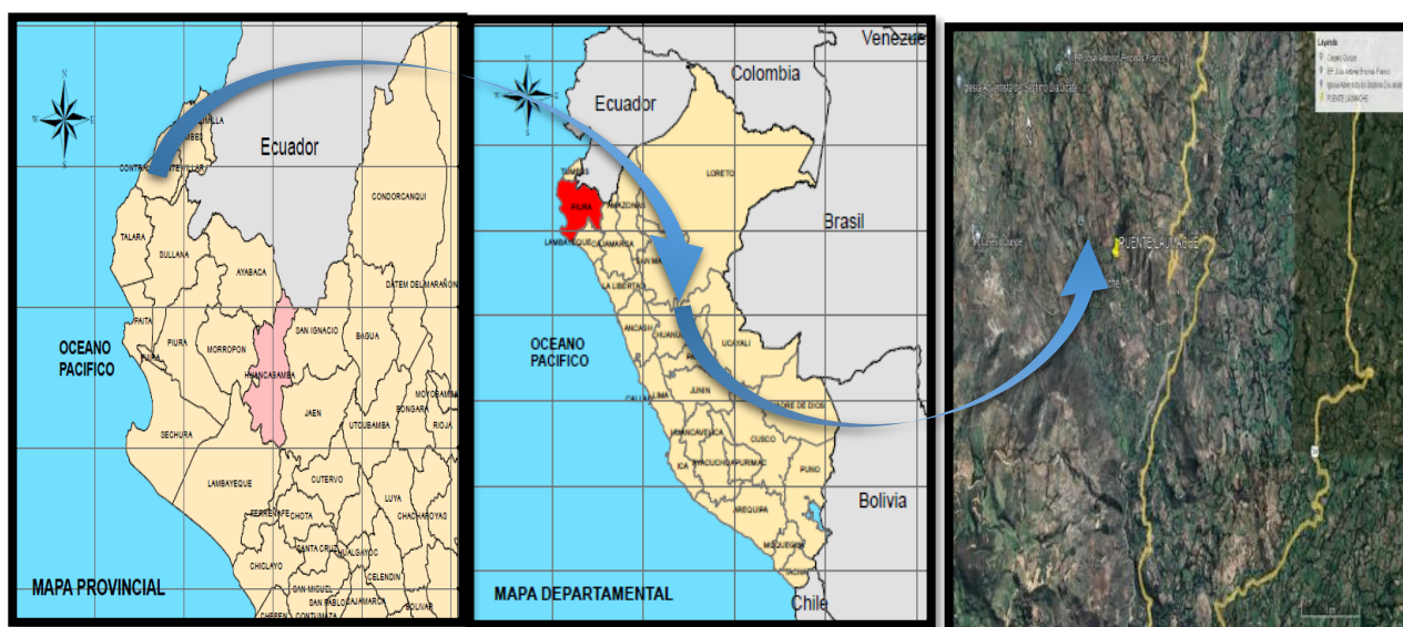
Figura N°01. Ubicación del proyecto a nivel departamental, provincial y Local