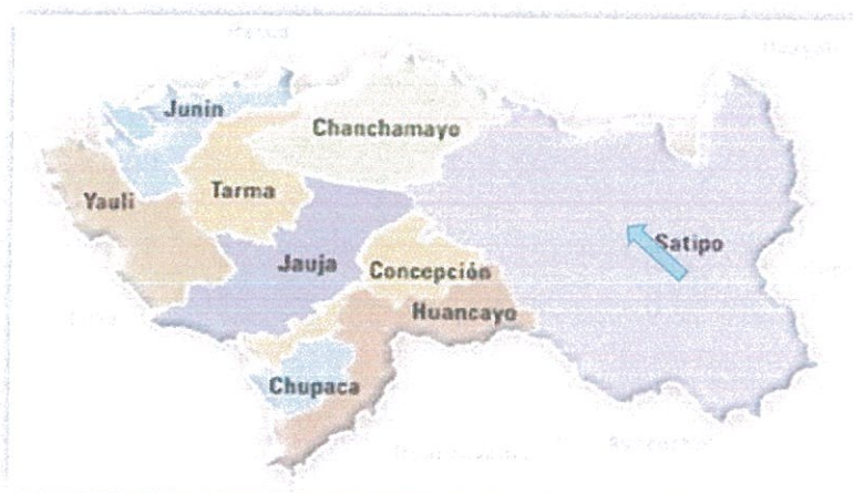
Figura 3. Mapa de ubicación del Distrito de Río Tambo

SUB GERENCIA de Mantenimiento de OBRAS PÚBLICAS