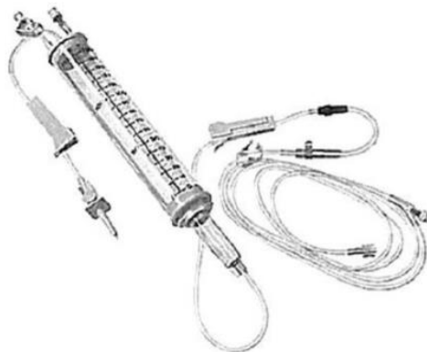
Fig. 1.: Línea para Bomba de Infusión con Volutrol (No implica diseño)