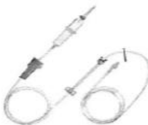
Fig. 1.: Línea para Bomba de Infusión sin Volutrol (No implica diseño)