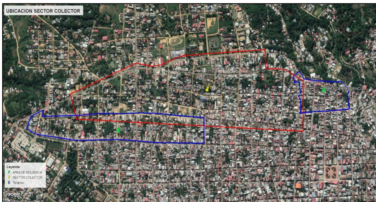
FIGURA N° 02: MACRO Y MICRO LOCALIZACIÓN DEL SECTOR COLECTOR