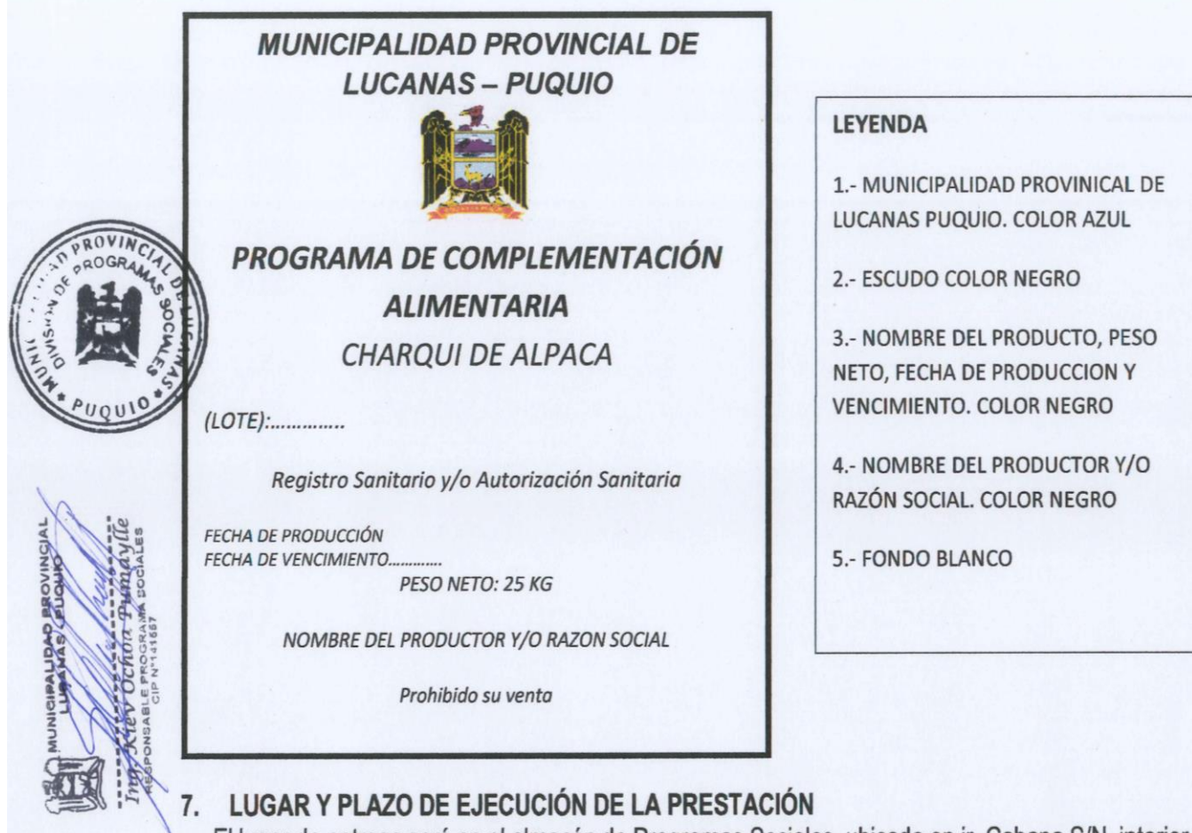
Figura 01: Modelo de rótulo.

pretenda remplazar la información consignada en el rotulado original, en ningún caso, a excepción de lo dispuesto por la Autoridad Sanitaria competente, siempre que no se refiera a la composición original del producto y cuya disposición no reemplace ni oculte la información del rotulado original.