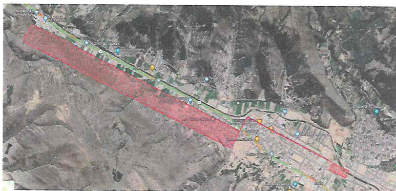
Imagen Nº 01: Ubicación de la Margen Derecha

Localidades: Toda la Margen Derecha de la vía Nacional Cusco – Sicuani (comprendidas las APVs Girasoles, Valllecito, Majeños, Condorccata, Mollemollec, Ferroviarios, Pampas del Olvido y Parcelas Santa Elena)