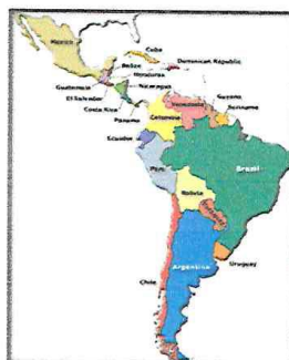
Mapa N° 1: Ubicación Macro