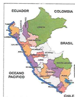
Mapa N° 2: Ubicación Micro