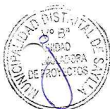
VALOR REFERENCIAL PARA LA ELABORACIÓN DEL ESTUDIO

El valor referencial del Estudio es considerando según el cuadro de detalle. El precio considera Gastos Generales, Utilidad y el Impuesto General a las Ventas (IGV) como cualquier otro concepto que pueda incidir en el costo de la consultoría.